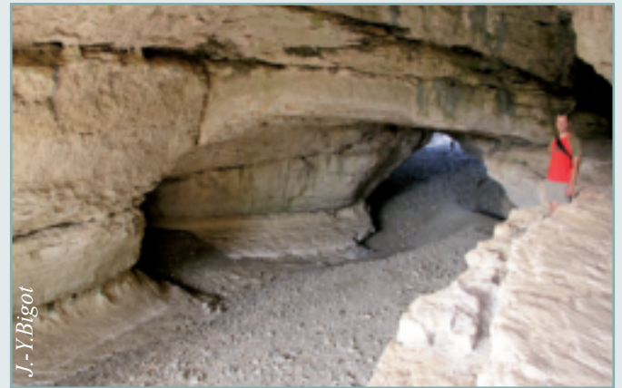
Figure 5 - Le Pont petit et le lit asséché de la Cesse.