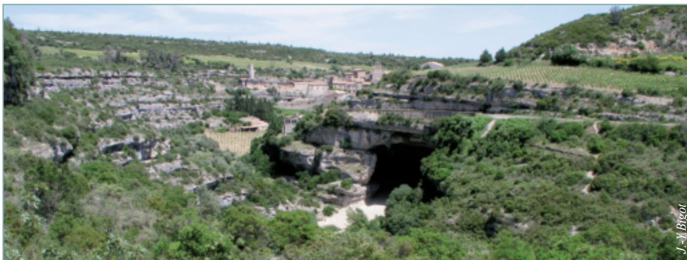
Figure 4 - Le Pont grand, recoupement d'un méandre de la Cesse par un tunnel naturel, dominé par le village de Minerve.

Avant la capture de la Cesse par l'Aude au niveau de Bize, la Cesse pliocène continuait son cours vers l'est pour rejoindre l'Orb, comme en attestent les témoins alluviaux situés 140 m au-dessus du cours actuel de la rivière [1].