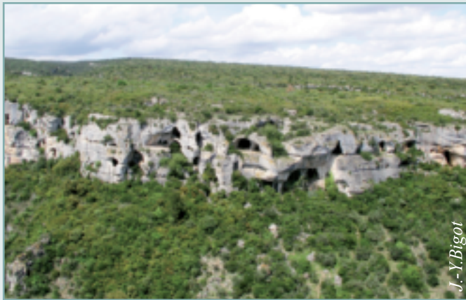
Figure 2 - En rive gauche de la Cesse, la corniche des calcaires à alvéolines est percée de grottes, tandis que la pente boisée masque les calcaires cambriens.